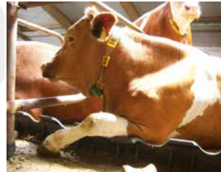
En skön mjuk yta ger en naturlig liggposition med utsträckt framben