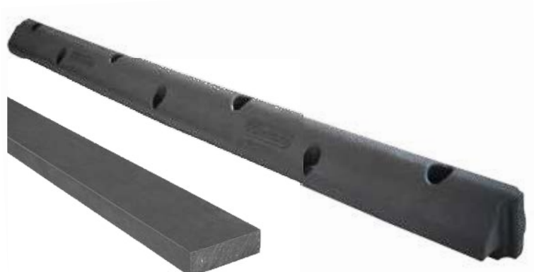
Plastskiva som underlägg för maxiBOARD till KEW Plus och WINGFLEX

Undersökningar visar: 20 % av djuren sträcker ut frambenet när de ligger ner utomhus. (Pelzer et al., 2007)