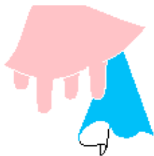
1. Papper fuktat med rengöringslösning