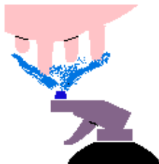
2. Spraya på Blu-Wash och torka efter med trasa